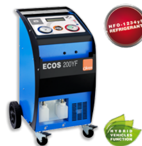
ECOS 200YF хладагент R1234yf