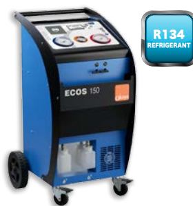
ECOS 150 хладагент R134a