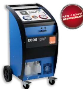
ECOS 150YF хладагент R1234yf