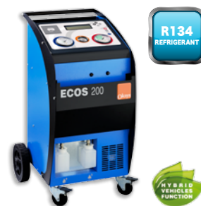
ECOS 200 хладагент R134a